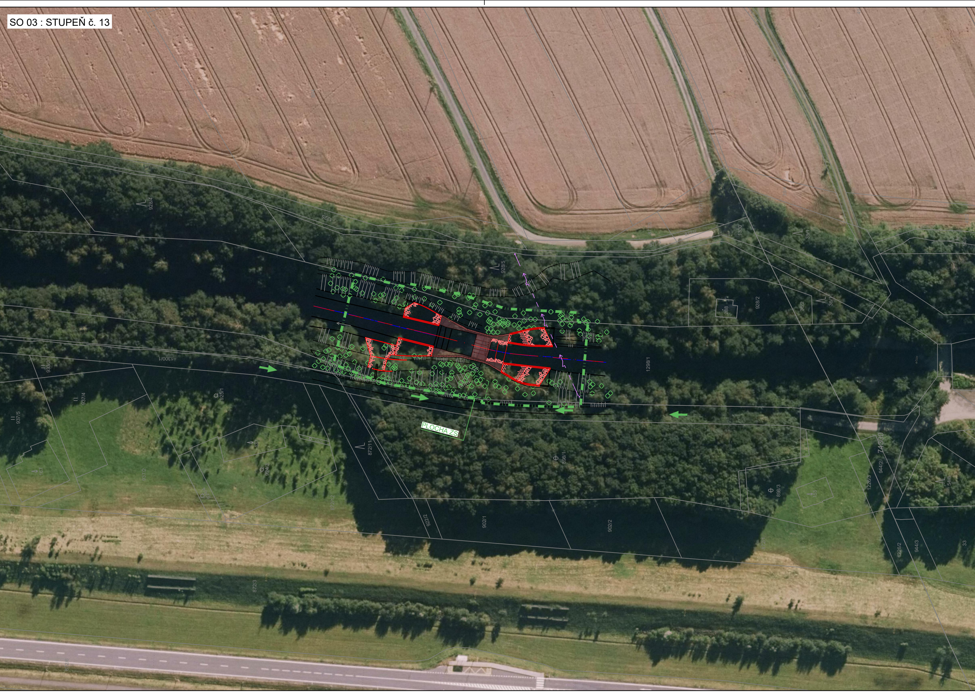
SO 03 : STUPĚŇ č. 13